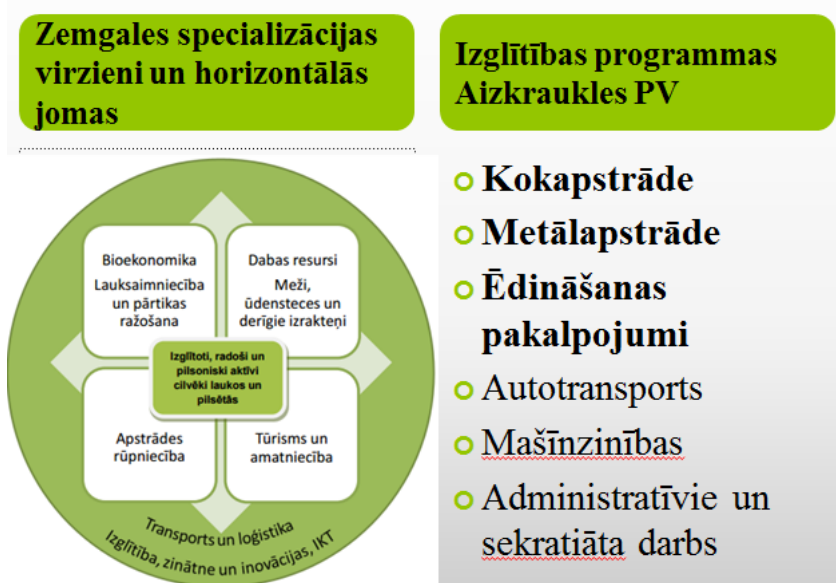
1.attēls. Izglītības programmu atbilstība Zemgales reģiona specializācijai

Skolas vīzija - Skola, kas mainās un attīstās! Tā ir viena no desmit labākajām profesionālās izglītības iestādēm Latvijā, kurā sagatavo autotransporta, metālapstrādes, ceļu būves un pakalpojumu nozarei nepieciešamos speciālistus.