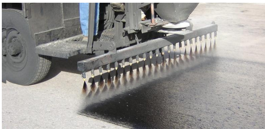
2. att. Apakšējo slāņu gruntēšana

Bituminētā kompozīta maisījuma ieklāšanas temperatūra atkarīga no bitumena klases. Izmantojot bitumenu ar klasi saskaņā ar LVS EN 12591, tā jāpieņem no 1.tabulas. Maisījumiem ar modificētajām saistvielām vai citām piedevām atsaucē temperatūra jāizvēlas tā, lai saistvielai būtu viskozitāte atbilstoši LVS EN 12595, kas ir līdzīga 1.tabulā dotajai. Maisījumiem ar reciklēto asfaltu atsaucē temperatūra jāaprēķina izmantojot kopējo penetrāciju, kas aprēķināta no pievienotās saistvielas un no reciklētā asfalta atgūtās saistvielas penetrācijām un proporcijām atbilstoši EN 13108-1:2001, EN 13108-2:2002, EN 13108-3:2000, EN 13108-4:2003, EN 13108-5:2000, EN 13108-6:2000 vai EN 13108-7:2000 A pielikumam.